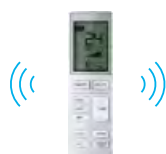
Sterownik bezprzewodowy YR-HBS01 (opcja)