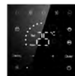
Sterownik przewodowy HW-BA101ABT (opcja)