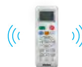
Sterownik bezprzewodowy YR-HE